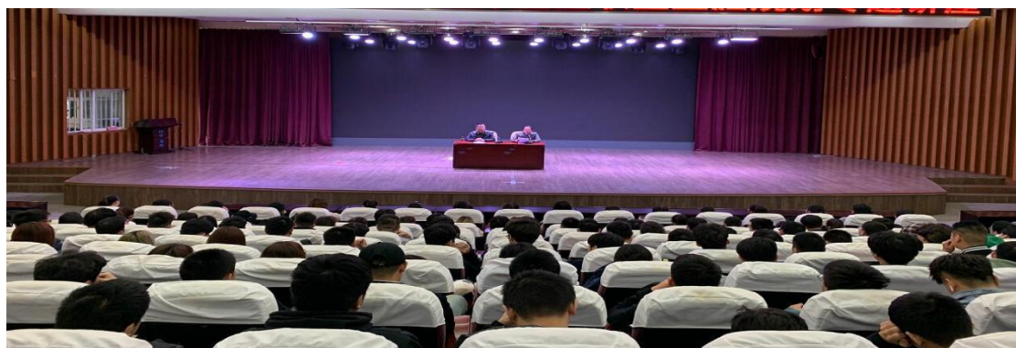
南京国博电子股份有限公司专家为师生作学术报告

2022年下半年起，南京国博电子股份有限公司针对校企合作班级开设“国博大讲堂”，定期推送企业专家讲座，丰富了校企合作班级的教学形式，效果良好。目前，双方正在合作进行计算机专业 1+X 证书开发，以求解决计算机专业无1+X 证书的难题。同时正在筹划在应天职业技术学院成立“计算机产业学院”，为双方下一步合作提供更便利的平台和合作载体。